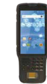
IBSD50(F) 手持指纹采集终端