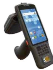
IBSD50RT(F) 手持指纹管理终端